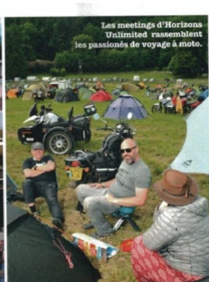
Les meetings d'Horizons Unlimited rassemblent les passionnés de voyage à moto.